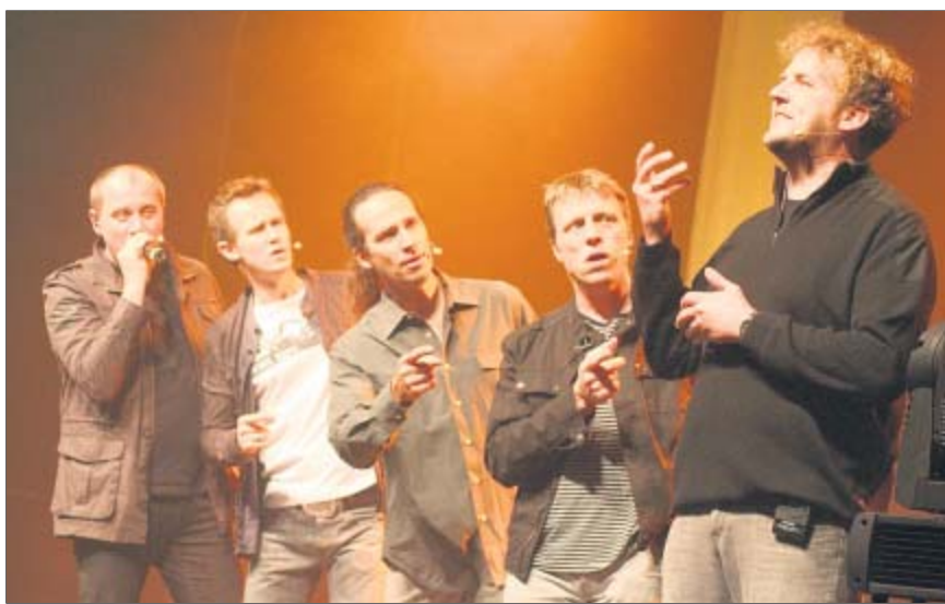
Die fünf Wise Guys in Bayreuth: Mundpropaganda

Verzweifelt suchen die Wise Guys in der Festspiel-Stadt nach einer Frau, die Kriemhild heißt. Schließlich soll sie eine handsignierte CD bekommen. Schnell steht fest, dass sich Kriemhild nicht unter den Wise-Guys-Fans befindet. Schließlich muss „eine Dame mit dem Namen Wagner“ reichen. Und prompt melden sie sich, die zahlreich im Saal weilenden weiblichen Wagners – alles Wise-Guys-Freunde.